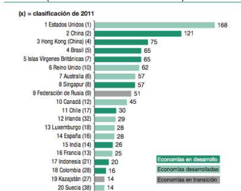
Grafico 2: Las 20 Principales economías receptoras en 2012 (En miles de millones de dólares)