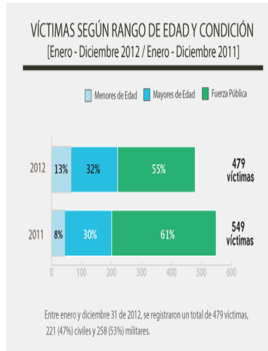
Figura 4. Víctimas artefactos explosivos improvisados 1990-2012 según rango de edad

Según los datos obtenidos en el período 1990 – diciembre 31 de 2012, se registraron “992 víctimas menores de edad. De éstas, el 22% (215) eran niñas, el 77% (767) niños y sobre el 1% (10) restante no se tiene información. Del total de los menores de edad víctimas, 774 (78%) resultaron heridos en el accidente, y 218 (22%) murieron. Entre enero y diciembre 31 de 2012, 52 menores de edad resultaron heridos como consecuencia de artefactos explosivos improvisados (20 niñas y 32 niños) y 13 fallecieron (1 niña y 12 niños)”. (Presidencia de la República, 2012).