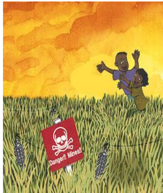
Figura 3. Film The Silent Shout

condiciones de vida de los niños, niñas y adolescentes del país”. (Ministerio de Comunicaciones, Embajada del Canadá, Fondo de las Naciones Unidas-UNICEF, 2000).