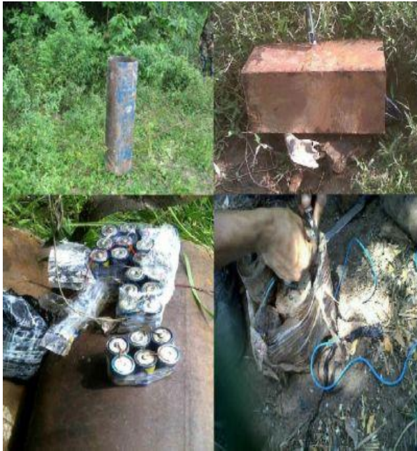
Figura 1. Artefactos explosivos improvisados