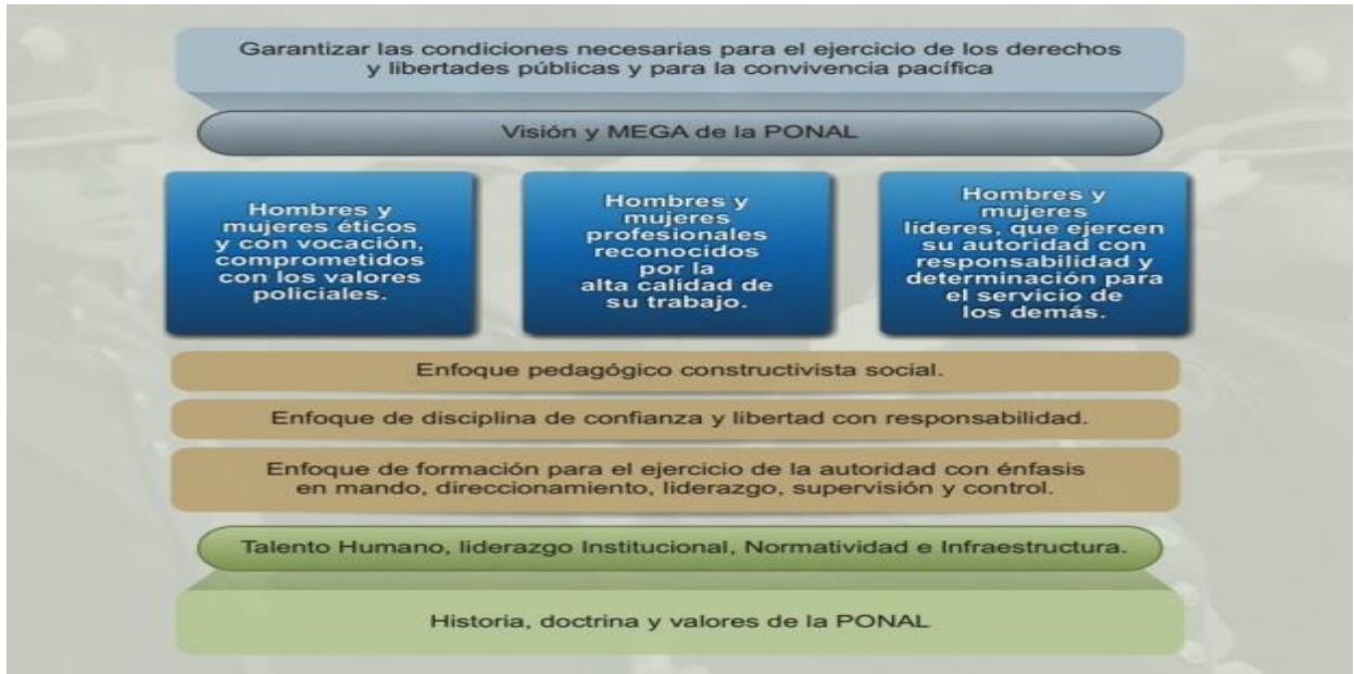
Figura 1. Modelo de Formación Proyecto 100

En esta figura se especifica la plataforma estratégica de la Policía Nacional de acuerdo a lo propuesto en el modelo de formación institucional Proyecto 100 y con los enfoques en los cuales se quiere profundizar.