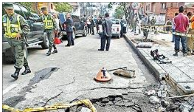
Figura 1. Atentado Terrorista contra el Senador Vargas Lleras calle 71 con carrera novena