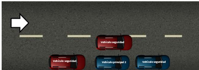
Formación con cuatro vehículos maniobra desembarque

Maniobra de protección con caravana de 4 vehículos ofrece muy buena seguridad y protección para el personaje y personal de seguridad