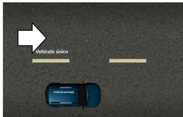
Formación con un vehículo

Esquema de maniobra con 1 un vehículo ofrece poca seguridad y protección para el personaje y personal de seguridad