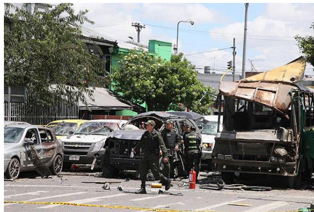
Figura 2. Atentado terrorista contra ex ministro Fernando Londoño Avenida Caracas calle 74