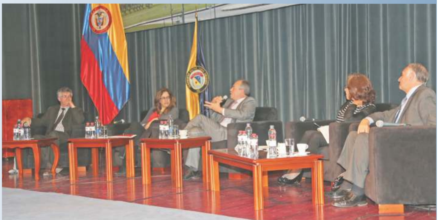
Los eventos más destacados de la jornada fueron el conversatorio en el que se hizo una retrospectiva de la evolución del servicio de Internet en nuestro país y la discusión sobre el futuro y los retos del país, para continuar con el proceso de masificación del uso de la red de redes.