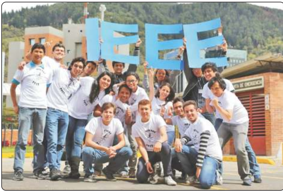
El IEEE Day es un evento global que se realiza el primer martes del mes de octubre.

Es muy importante destacar que la colaboración entre estudiantes y profesores es el motor de la Rama, razón por la que se han planeado actividades de integración que