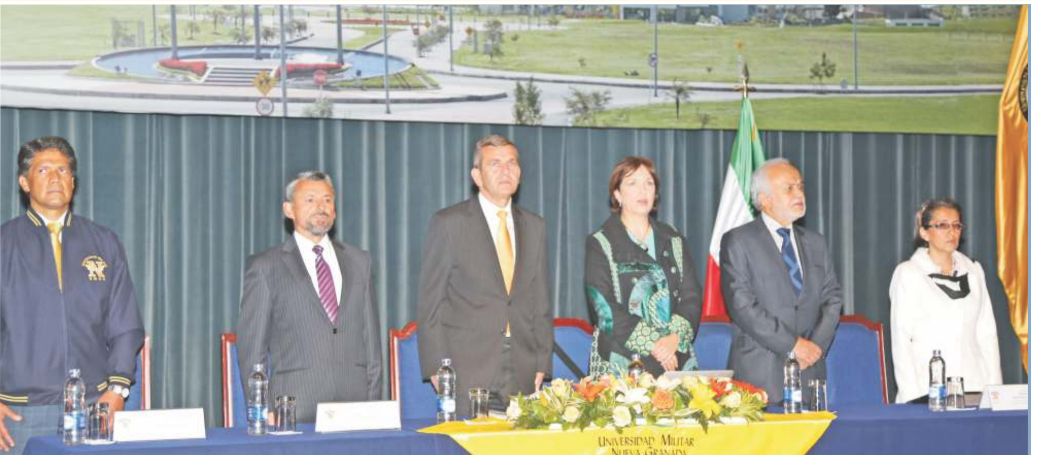
La viceministra de Tecnologías y Sistemas de la Información, los rectores y decanos de las facultades de ingeniería de las instituciones organizadoras del evento y el director del ITEC presidieron la mesa de instalación del evento.