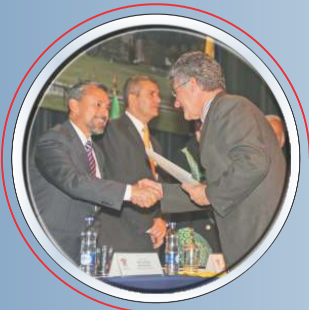
El doctor Hugo Sin Triana recibió un reconocimiento por su labor como uno de los pioneros que gestaron la llegada de la internet pública a nuestro país.