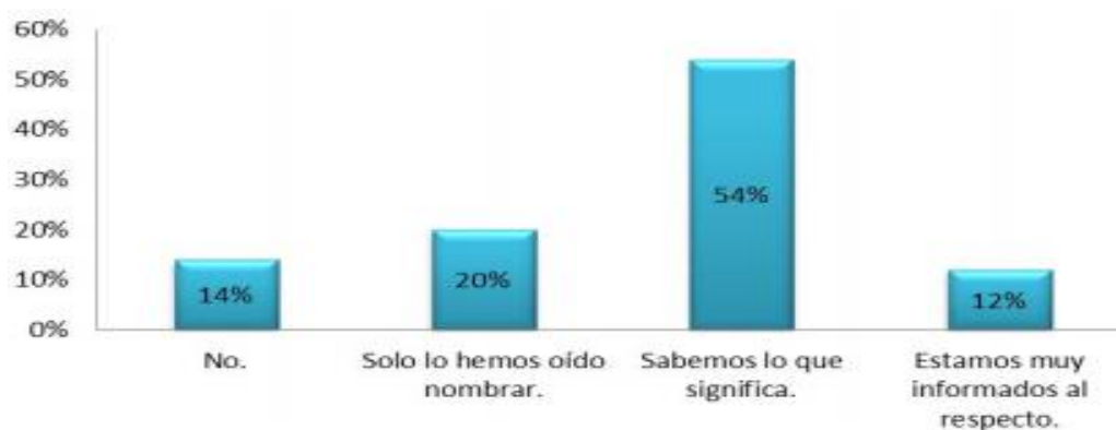
Grafico 1. Conocimiento del concepto de RSE por los empresarios Colombianos