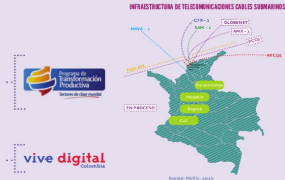
7 Infraestructura, costos atractivos y ubicación privilegiada

Herramientas disponibles para facilitar la operación en aspectos como la exportación de servicios (Plan Vallejo para la exportación de servicios), derechos de propiedad intelectual, Ley Estatutaria de Hábeas Data, exención del impuesto al valor agregado (IVA) a servicios prestados desde Colombia, posibilidad de aplicar al régimen de zonas francas, Ley de Primer Empleo y posibilidad de beneficiarse del Teletrabajo.