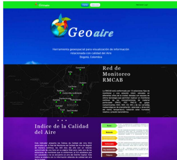
Figura 2. Interfaz Front End

La interfaz final o “front end”, es una herramienta que el usuario final utilizará para la visualización de los datos espacializados. La interfaz fue denominada “Geoaire” y está comprendida por dos secciones, la página principal, de inicio o “home” ( Figura 2. ), en la cual se encuentra información de referencia acerca de la RMCAB e Índice de la Calidad del Aire y la segunda sección, denominada “Geovisor” ( Figura 3. ), donde se encuentra la aplicación web de mapas construida.