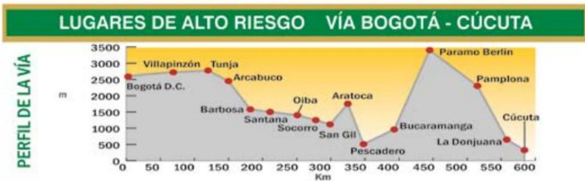
Ilustración 4. Vía Bogotá-Cucutá