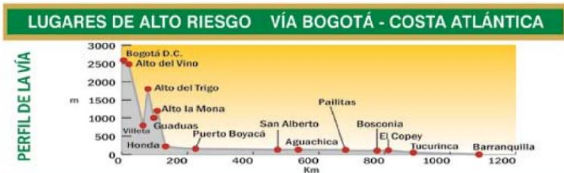
Ilustración 5. Vía Bogotá-Costa Atlántica