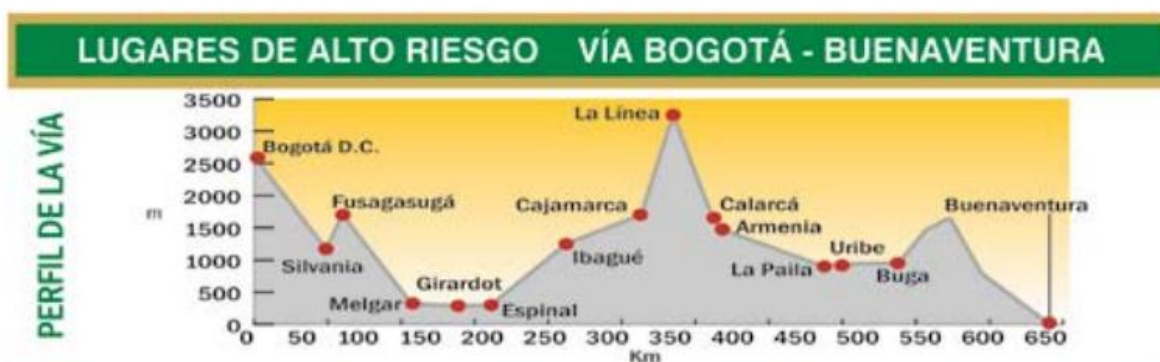
Ilustración 2. Vía Bogotá-Buenaventura