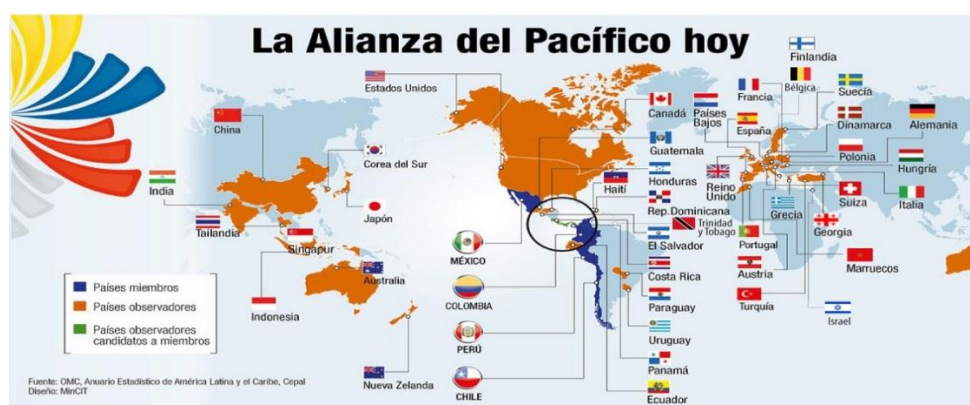
Imagen 1. La AP hoy

El canciller Muñoz (2015) expresó “Este evento es una actividad que nosotros propusimos a nuestros socios para avanzar en este mandato de integración entre los cuatro países de Alianza del Pacífico, además quisimos dirigirlo especialmente a las pymes, pues sabemos que éstas son las que crean más empleo, generan más integración social y hoy hay una necesidad de ayudarles en su internacionalización. Por lo tanto, la idea es colaborar en capacitarlas, darles herramientas para que accedan a los mercados” .