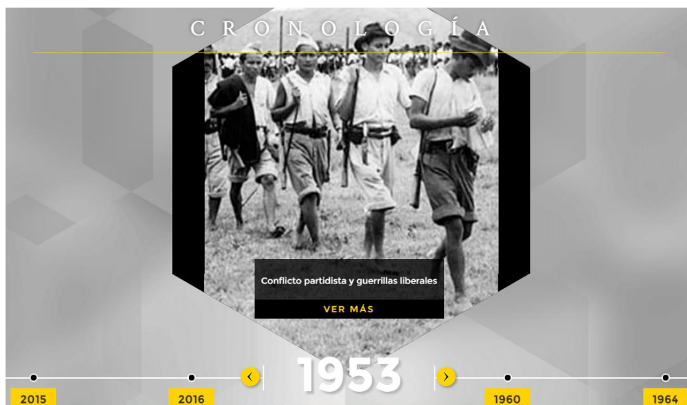
Imagen 1 archivo CRONOLOGÍA.