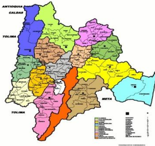
Figura 3. PROVINCIAS DE CUNDINAMARCA