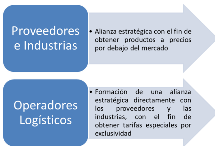
Figura 5. SRM- Supplier Relationship Management

Por otra parte de cara al consumidor, las alianzas serán administradas mediante el adecuado manejo de CRM - Customer Relationship Management, término de la industria de la información que se aplica a metodologías, software y, en general, a las capacidades de Internet que ayudan a una empresa a gestionar las relaciones con sus clientes de una manera organizada. [9]