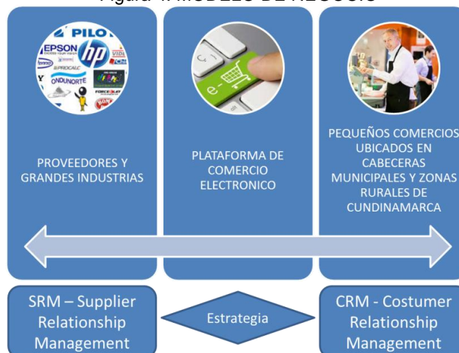
Figura 4. MODELO DE NEGOCIO

En este caso, la plataforma de comercio electrónica está contemplada como un punto de interacción entre los pequeños comercios y las grandes industrias, por lo cual se hace necesario contar con un adecuado manejo de alianzas estratégicas con el fin de garantizar los beneficios y valor agregado planteado.