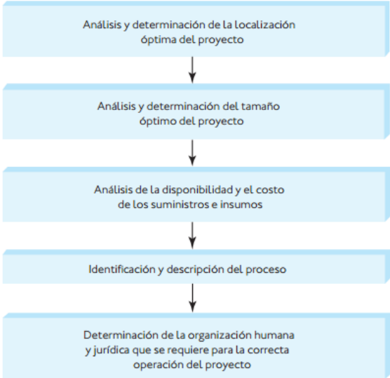
Figura 2. PARTES QUE CONFORMAN UN ESTUDIO TÉCNICO.

Una vez analizado el mercado, se debe establecer el estudio técnico, el cual presenta la determinación del tamaño óptimo de la planta, la determinación de la localización óptima de la planta, la ingeniería del proyecto y el análisis organizativo, administrativo y legal. [3]. (ver figura 2)