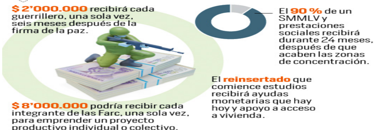
Imagen 2 incentivos económicos a los excombatientes

Son útiles todos estos apoyos económicos que pondrá a los individuos en una posición de iniciar su vida en sociedad. Pero ello lleva implícito la otra parte, que consiste en reparar a las víctimas, hacer el acto de pedir perdón. Este acto de conciliación debe hacerse cuando se reconozca en el individuo un total arrepentimiento y adquiera un compromiso suficiente que conlleve a la no repetición de actividades ilegales. Solo así se puede hablar de reintegración a la vida civil ya que deja de un lado su pasado, sus temores y angustias para ser nuevamente miembro de la sociedad.