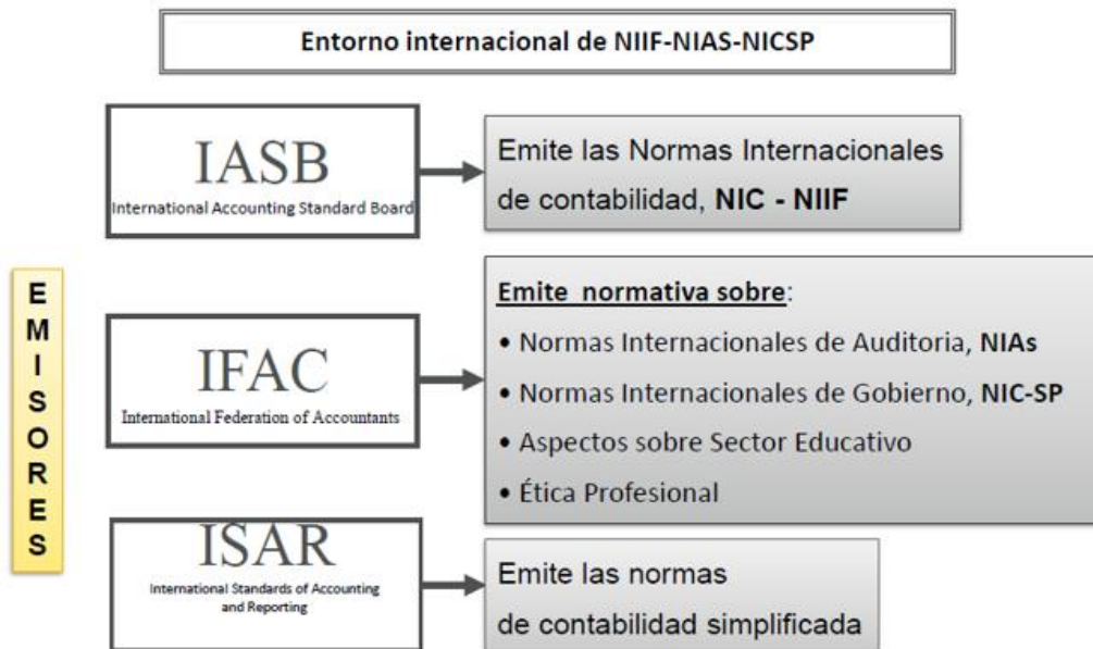
Ilustración 2 ENTES EMISORES DE LAS NORMAS INTERNACIONALES DE CONTABILIDAD

En el mismo año 2001 la IASC fue reestructurada y se convirtió en la IASB. En esa oportunidad se decidió que las normas emitidas hasta esta fecha serían revisadas, actualizadas y refrendadas por la IASB, conservando el nombre de NIC y que las nuevas normas contables que se emitieran a partir de esa fecha, se designarían con el nombre de NIIF (Normas internacionales de Información Financiera). (IASB, 2001).