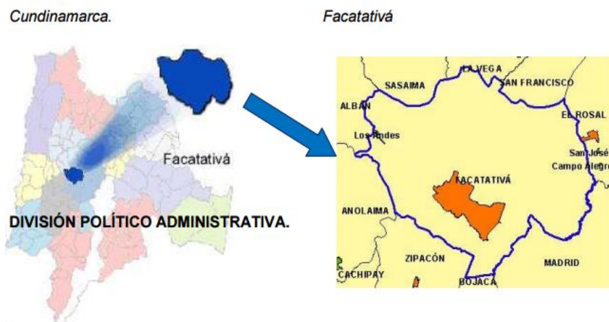
Grafico No. 2. Municipio de Facatativá- Cundinamarca-Colombia

Facatativá se ubica en el departamento de Cundinamarca, a unos 36 km de Bogotá, capital de Colombia, hacia el occidente. Su extensión territorial de 159.6km 2 , con 5.1 Km 2 de zona urbana y 154.5 Km 2 de zona rural, le hacen limitar geográficamente con Sasaima, La Vega, San Francisco por el norte; por el sur Zipacón y Bojacá; por el oriente con Madrid y El Rosal; y por el occidente con Anolaima y Albán. Su temperatura varía según la época del año, pero hay extremos entre los -9°C a la madrugada y los 22°C al medio día.