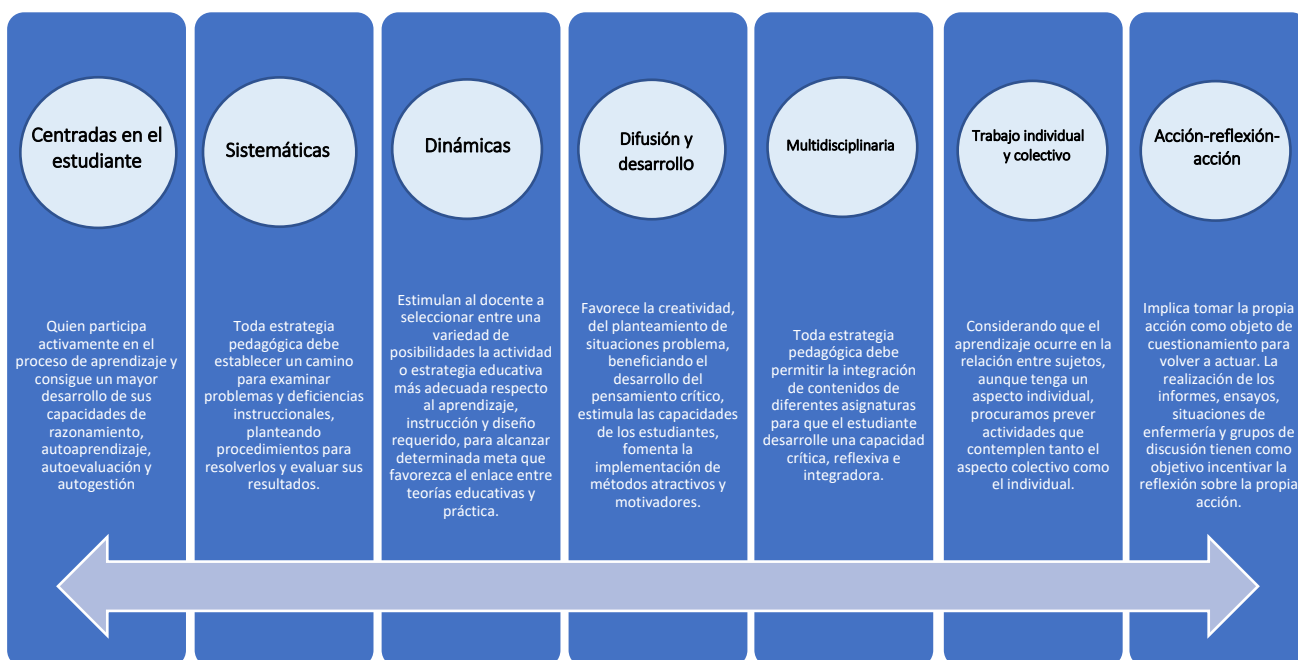
Imagen 1: Características de las nuevas estrategias para la enseñanza-aprendizaje.