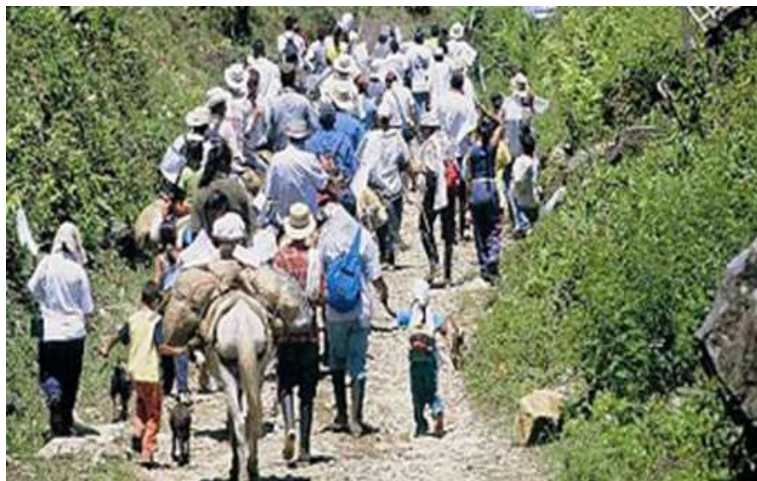
Imagen # 4. Colombia entre los que más desplazados tiene en el mundo.

población campesina, lo primero por la misión del proyecto paramilitar y lo segundo en función de la orientación política y económica del poder.