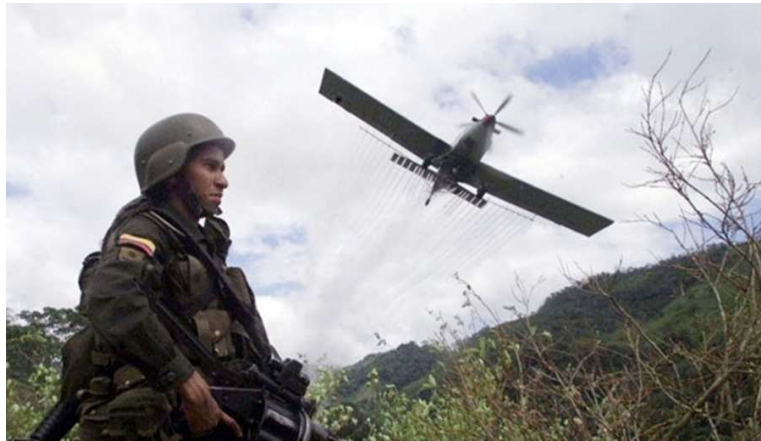
Imagen # 3. Fumigaciones aéreas con glifosato.

Para los años 2001 al 2006 como novena época del proceso histórico del desplazamiento forzado, las fumigaciones de cultivos ilícitos con glifosato incidieron notablemente en el desplazamiento de familias enteras de la población campesina en las zonas de los grandes cultivos de Coca del país; estas acciones del gobierno fueron vistas como actos de represión, atropello y de agresión por los campesinos por cuanto muchos de ellos se vieron afectados por la pérdida de cosechas de alimentos y animales domésticos, que les servían para su sustento y comercialización.