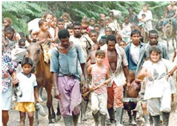
Imagen # 1: Población desplazada colombiana.

Pescadero Ituango en Antioquia; el cultivo de la hoja de coca, en la mayoría de los departamentos geográficos del país; la tenencia de la tierra enmascarada por testaferros del narcotráfico, delincuencia común y contratistas inescrupulosos que esconden sus dineros bajo esta modalidad; combates por parte de la Fuerza Pública en contra de la subversión y el paramilitarismo, en donde no se evidencia una contundencia pertinente contra la fuerza irregular y por lo contrario, se refleja cierta incapacidad estatal; afectación económica presentada en el contexto de la mayor inequidad económica, debido a los altos niveles de concentración del ingreso y de la propiedad; el aumento en un 40% de los municipios del país que han sufrido los éxodos masivos, familiares o individuales de quienes se ven obligados al destierro y dejarlo todo para defender y proteger la vida, emigrando hacia las grandes urbes.