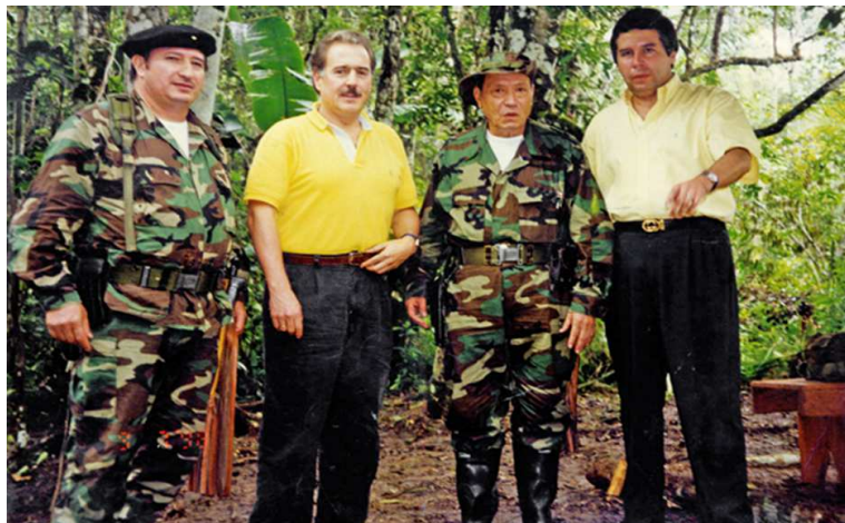
Imagen # 2. Tratado de Paz en Colombia. Una vida guerrillera.

En el año 1998, y coincidiendo con las conversaciones de paz entre el Gobierno de Andrés Pastrana Arango 12 y las autodenominadas Fuerzas Armadas Revolucionarias de Colombia-Ejército del Pueblo (FARC-EP), se creó en el municipio de San Vicente del Caguán, localizado en el departamento del Caquetá, la llamada “Zona de despeje”, un área libre de la presencia del ejército y representantes del Estado. A pesar de la mediación de diversos gobiernos y de organismos internacionales, las conversaciones fracasaron y el ejército volvió a tomar el control de esta zona en el año 2002.