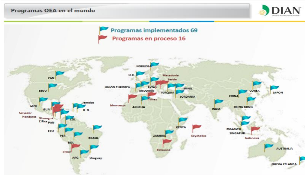
Ilustración 1: Programas OEA en el Mundo