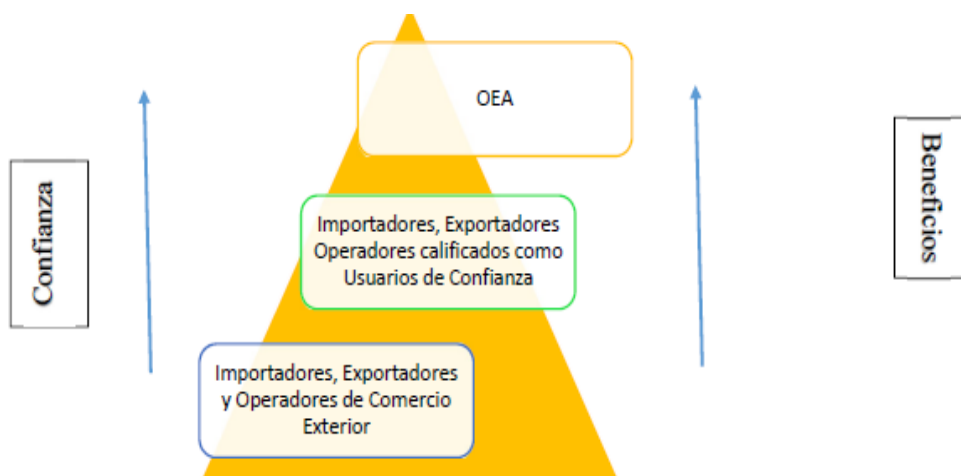
Ilustración 2: Nivel de Confianza.