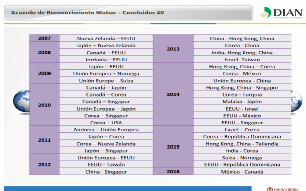
Tabla 2: Acuerdos de Reconocimiento Mutuo (ARM).

Los Acuerdos De Reconocimiento Mutuo (ARIM) son compromisos firmados entre administraciones de aduanas, en los que se reconocen los programas Operador Económico Autorizado (OEA) implementados en cada país; son suscritos entre gobiernos y buscan otorgar beneficios a las empresas certificadas en cada país. Más adelante veremos los programas implementados en cada País, como última fase se encuentran (ARIM) (OMA, 2011, P.2)