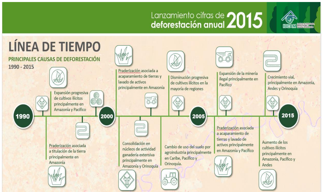
Imagen 1: Línea de tiempo principales causas de deforestación en Colombia

Además de esto la amazonia afronta también problemas como la deforestación, que ha ido en aumento debido a varios factores como la proliferación de cultivos ilícitos, la extracción de madera indiscriminada, la minería ilegal que también se convierte en un foco de contaminación de las afluentes por el vertimiento de sustancias químicas usadas en dicha actividad. Igualmente se evidencia la pérdida de bosques por parte de la construcción de infraestructura vial tanto ilegal como legal.