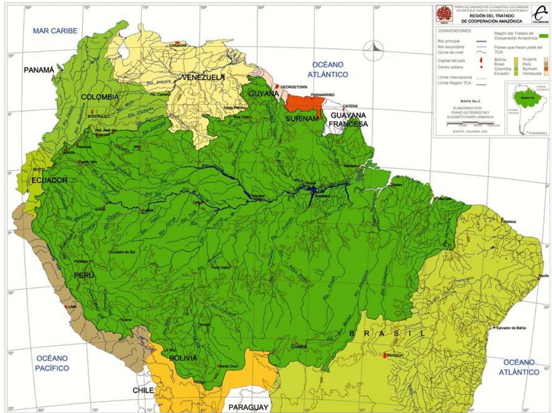
Imagen 3. Mapa de Región del Tratado de Cooperación Amazónica. Colombia, Ecuador, Perú, Bolivia, Venezuela, Guyana, Surinam, Brasil.