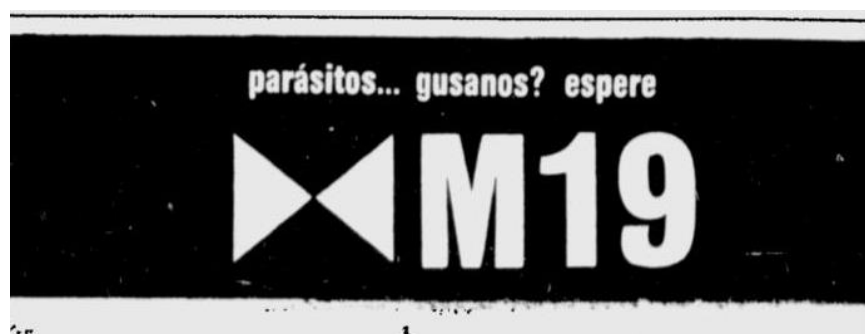
Ilustración 3. Propaganda del M19 en contra de la opresión del gobierno

Tomado de: (Fundacion para la investigacion y la cultura, 1980)