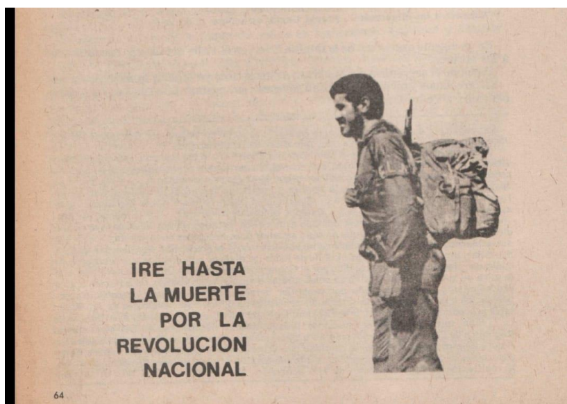
Ilustración 1. Arte urbano (Fundacion para la investigacion y la cultura, 1980, pág. 64).

Las propuestas artísticas no se podían quedar atrás, las caricaturas de Chapeta, que eran una forma no convencional de atacar la legitimidad del gobierno y el arte urbano también tuvieron una gran acogida en los procesos de liberalización y fueron fuertes referentes para la opinión pública (Acevedo Tarazona & Pinto Malaver, 2015).