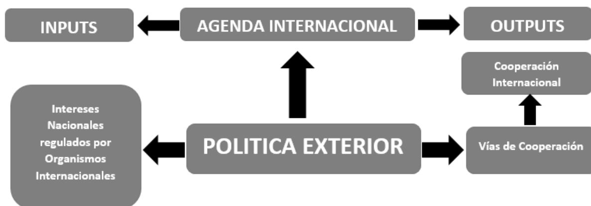
Gráfico 1 Política exterior y cooperación internacional

Fuente: Elaboración propia con datos tomados de documentos virtuales (Pedraza Beleño, Jose Adolfo | Duarte Herrera, Lisbeth Katherine, 2016).