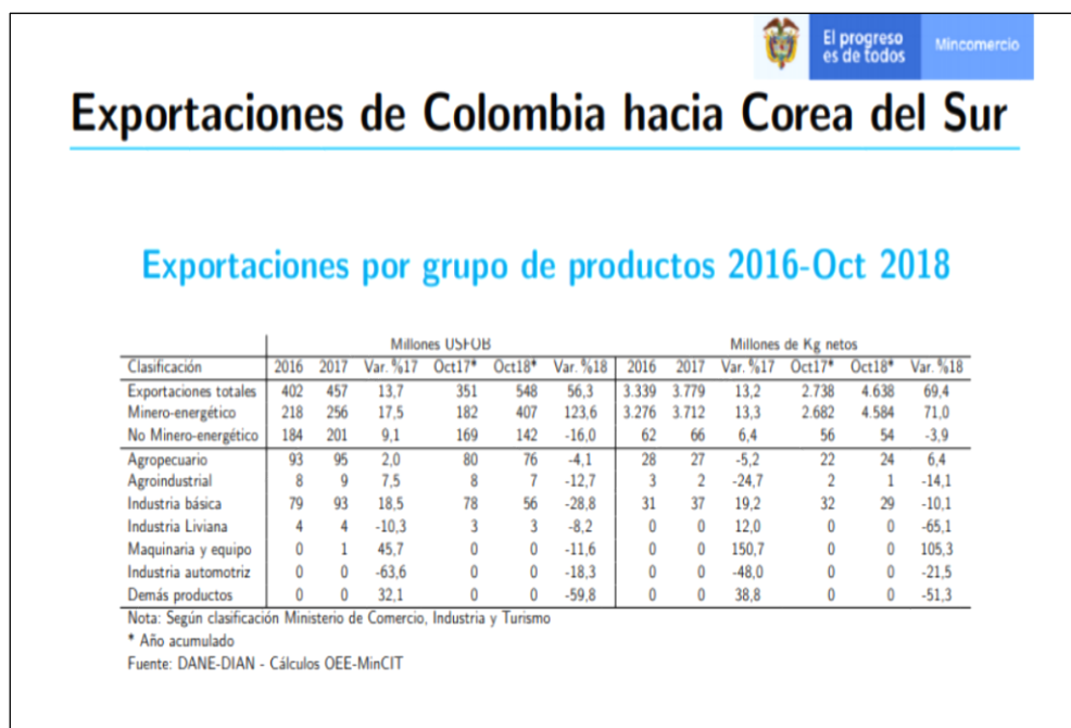
Figura 2. Descripción por grupos de productos exportados desde Colombia a Corea del Sur - 2016-2018

comparado con el corte en el mismo mes en el año inmediatamente anterior. Por otra parte, la comparación de exportaciones discriminada entre productos minero energético y otros productos diferentes a ese segmento, muestran un comportamiento de incremento moderado entre 2016 y 2017 y un aumento del valor de exportación de recursos minero-energéticos del 123% con corte a octubre de 2018, de acuerdo con este análisis, Colombia solo logro aumentar la exportación el volumen de recursos de extracción minera y en otros productos la tendencia es a la baja.