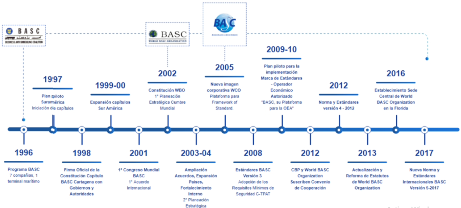
Figura 2: Historia BASC. (World Basc Organization, 2018)

Conforme a lo expuesto por la WBO (World Basc Organization) las empresas, aduanas y países que se convierten en miembros y se consolidan como empresas certificadas BASC obtienen una serie de beneficios tales como: reconocimiento internacional, Inclusión en la base de datos de empresas certificadas de WBO, disponibilidad de equipos de auditores internacionales competentes para la implementación y revisión BASC, representatividad y facilitación de contactos ante las autoridades vinculadas al comercio exterior, mayor confianza por parte de las autoridades, disminución de costos y riesgos derivados del control a sus procesos, transferencia de conocimiento y experiencia en Seguridad de la Cadena de Suministro, facilitación de contactos en diferentes países a través de los capítulos BASC, cursos de formación especializados en temas relacionados a la seguridad del comercio internacional, mejorar los perfiles de riesgo y evaluación de amenazas, maximizar los recursos de la aduana, trabajar con las empresas para mejorar los procedimientos internos en función de un país específico, y finalmente y tal vez la más importante, evitar de manera más eficiente el fraude aduanero, contrabando, terrorismo, tráfico ilícito de estupefacientes y el desvío de productos químicos precursores de