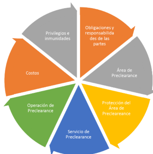
Ilustración 1. Descripción general del acuerdo.

- A continuación, se presentan los principales puntos a tener en cuenta en la implementación de este programa, de acuerdo a lo establecido por el U.S. Customs and Border Protection, como se aprecia en la Ilustración 1 y explica más adelante.