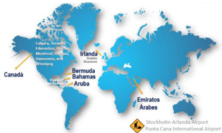
Ilustración 2. Países y ciudades en donde funciona el programa “Preclearance”

Existen 15 aeropuertos en seis (6) países diferentes, en los cuales se preautorizan alrededor de 18 millones de pasajeros anualmente con destino a los Estados Unidos, los que se identifican a continuación: