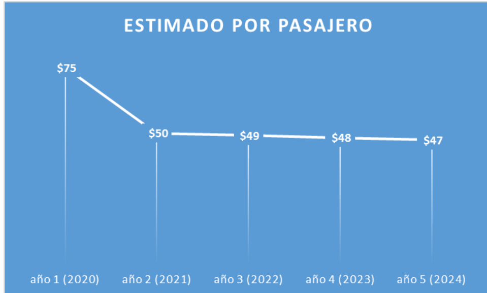
Ilustración 4. Costo estimado por pasajero