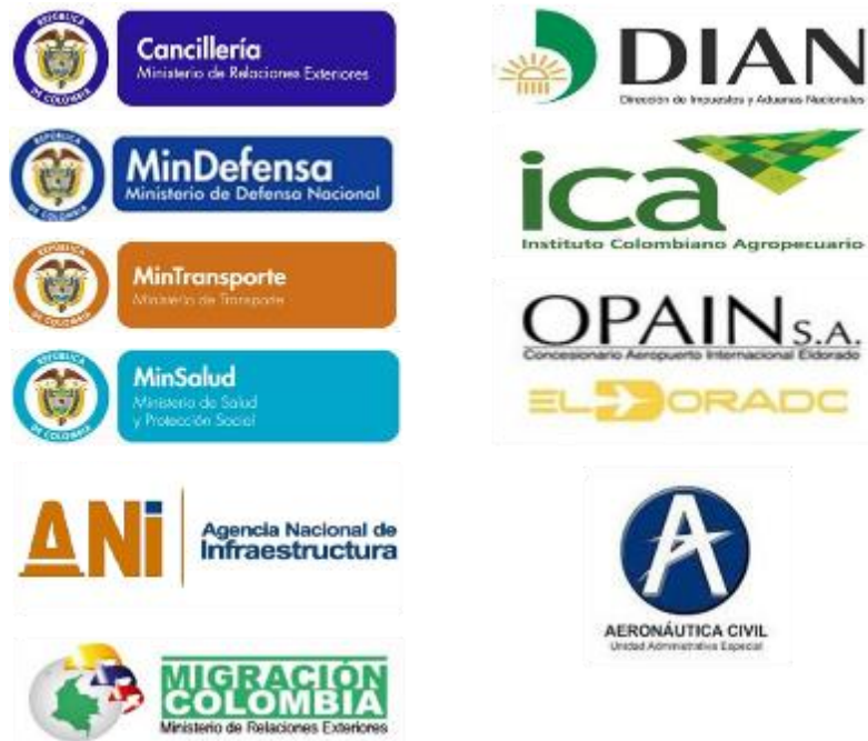
Ilustración 3. Entidades involucradas en la implementación del programa “Preclearance”