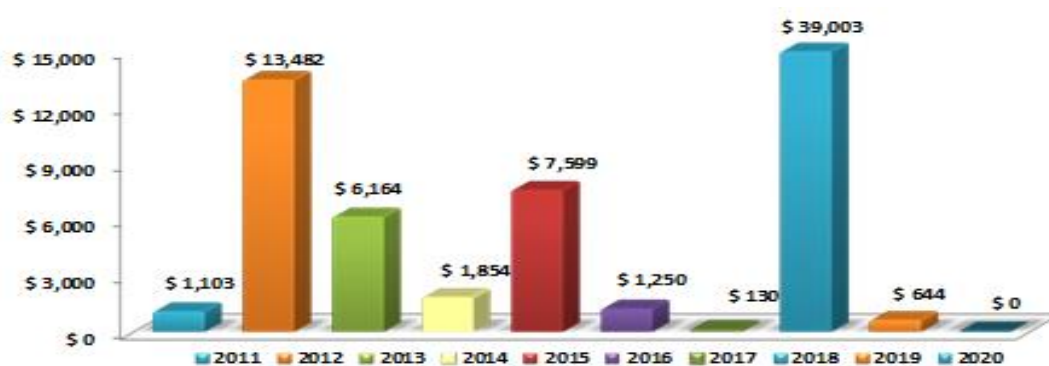
Ilustración 2 cuadro recursos girados al tesoro nacional con destino a la ley de Presupuesto