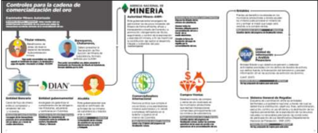
Tomado de: universidad nacional de Colombia, 2017. Guía de comercialización legal de oro en Colombia.

Estos dos casos, GOLDEX al ser un caso colombiano y NTR Metals en Estados Unidos tienen un mismo actuar, la procedencia del oro no es lo relevante en el proceso de exportación e importación, lo importante es que el metal llegue o salga del país para su comercialización ya sea por medio de casas de cambios, empresas fantasmas, lavado de dinero o comercializadoras internacionales.