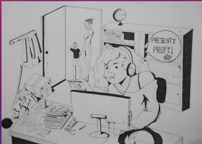
2 puesto: Natalia Sofía Porras Pineda