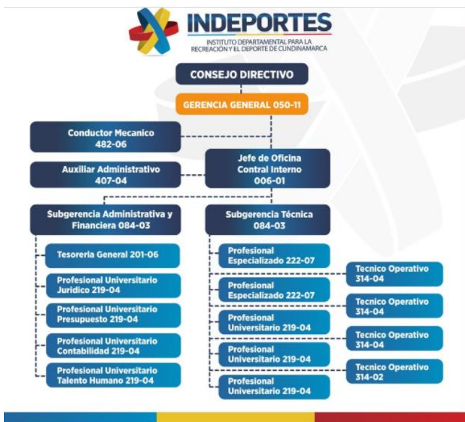
Figura 1. Organigrama Indeportes

Indeportes Cundinamarca está conformado por la Gerencia General, subdividido por dos Subgerencias, Subgerencia Administrativa y financiera y Subgerencia Técnica, quienes son los ejes fundamentales para dar cumplimiento a la misión y visión de la Entidad, donde se ejecutan y se organizan las decisiones de implementación del deporte a nivel departamental.