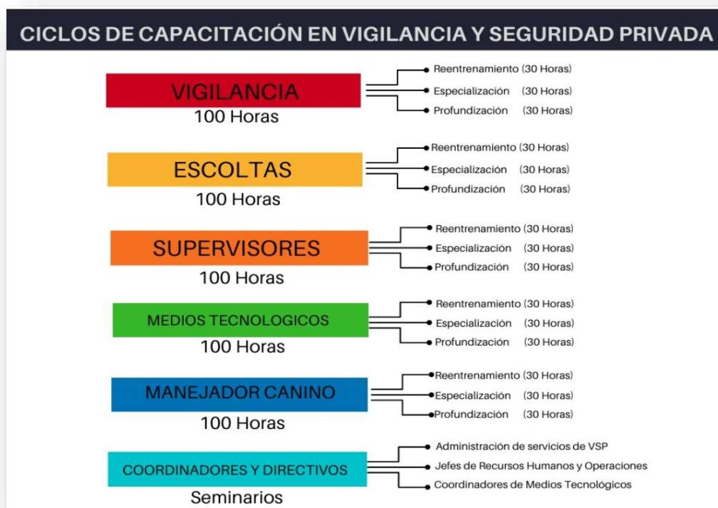
Gráfico 7. Ciclos de capacitación en vigilancia y seguridad privada