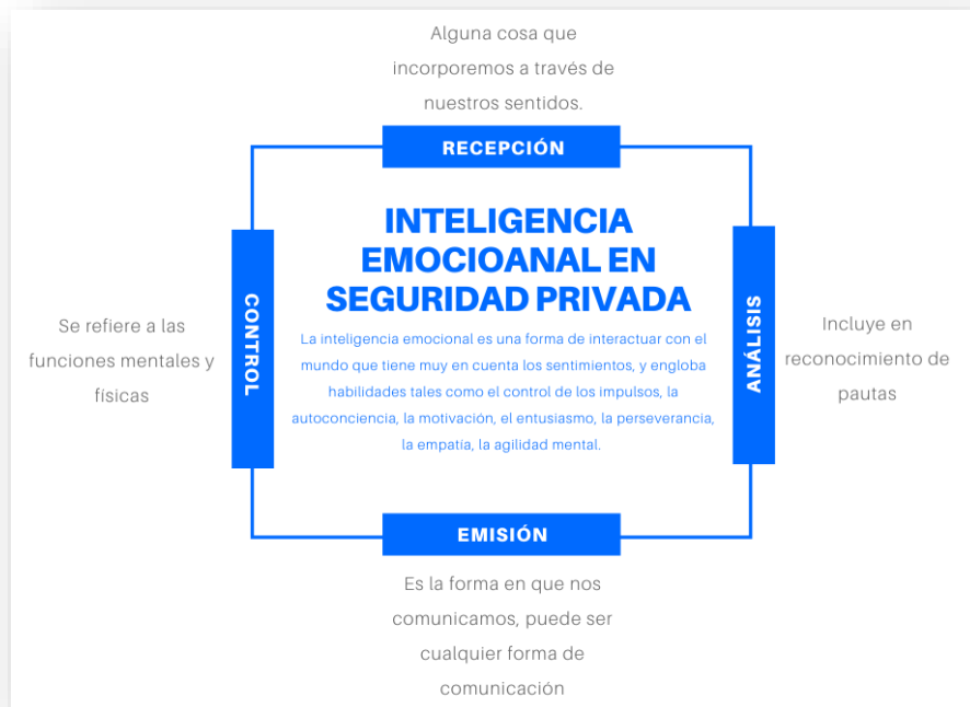
Gráfico 2. Inteligencia emocional en Seguridad Privada

Fuente: Libro Inteligencia Emocional – Daniel Goleman