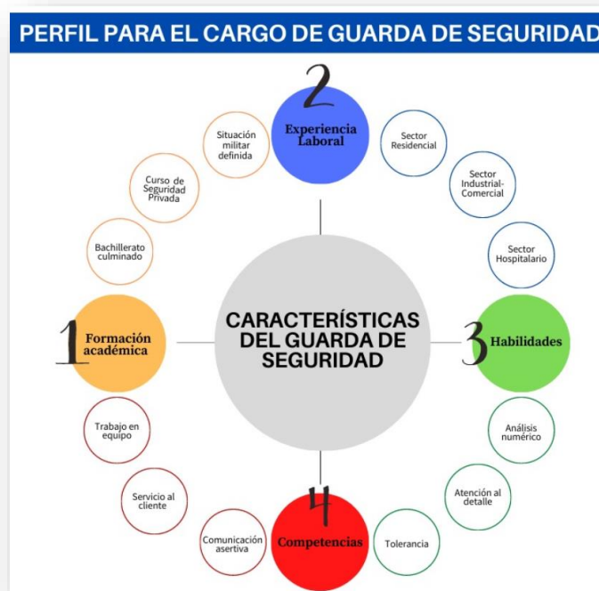
Gráfico 4. Perfil par el cargo de guarda de seguridad