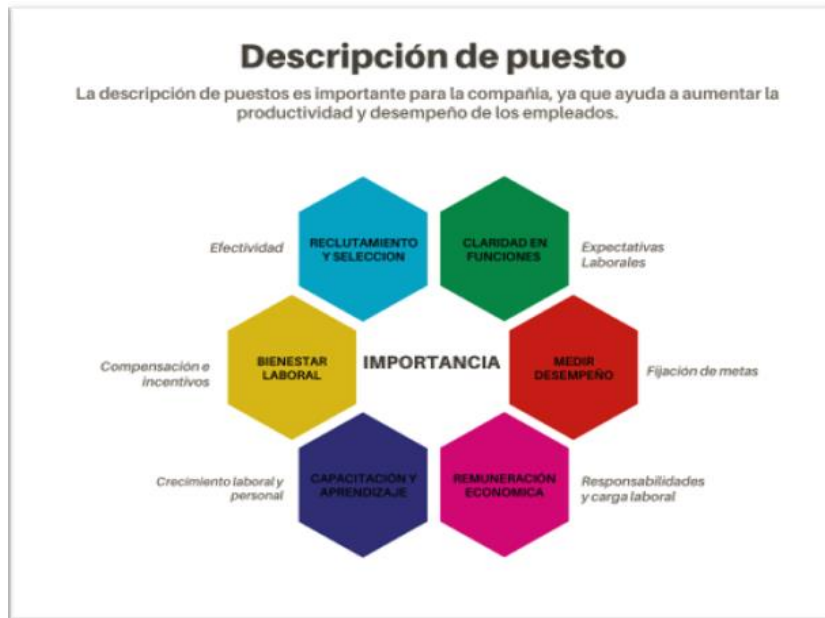
Gráfico 1. Descripción de puesto