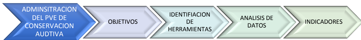
Figura 2. Administración de un programa de conservación auditiva