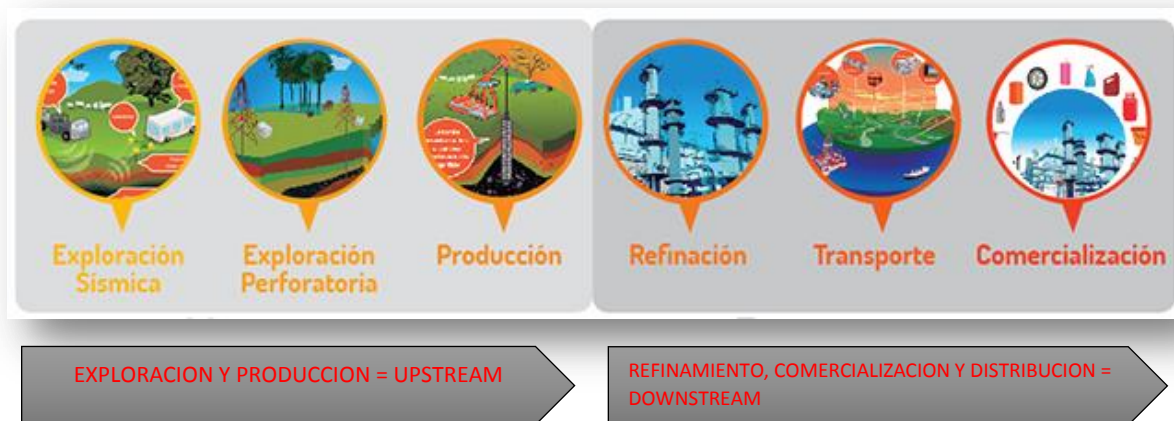
Figura 1. Cadena de Valor Sector de Hidrocarburos