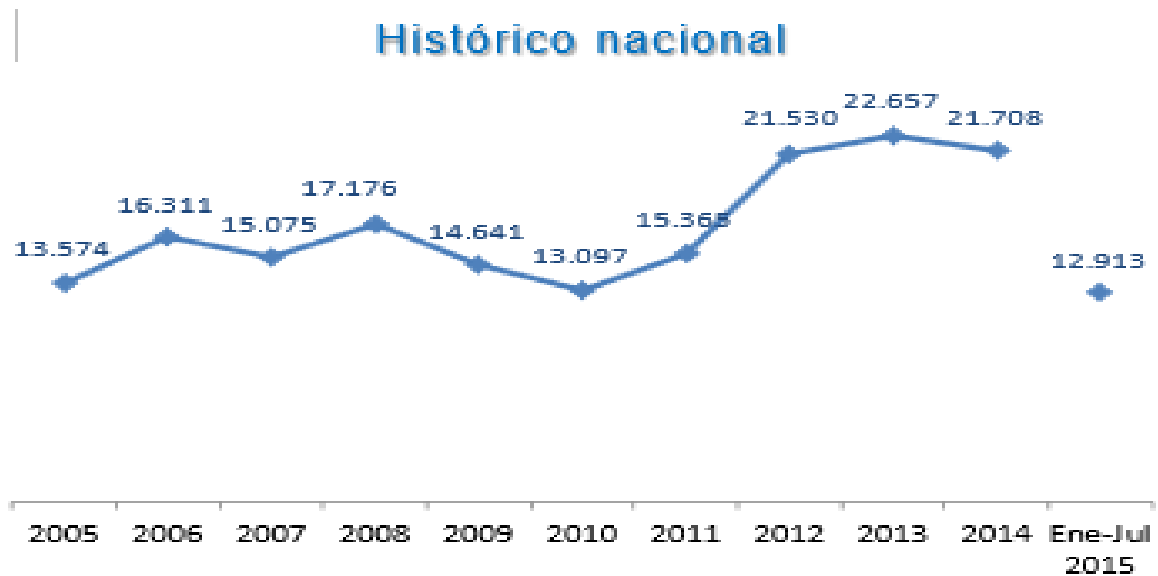
Gráfico N° 2. Fuente: Ministerio de Defensa Nacional. Logros de la Política Integral de Seguridad y Defensa para la Prosperidad – PISDP.