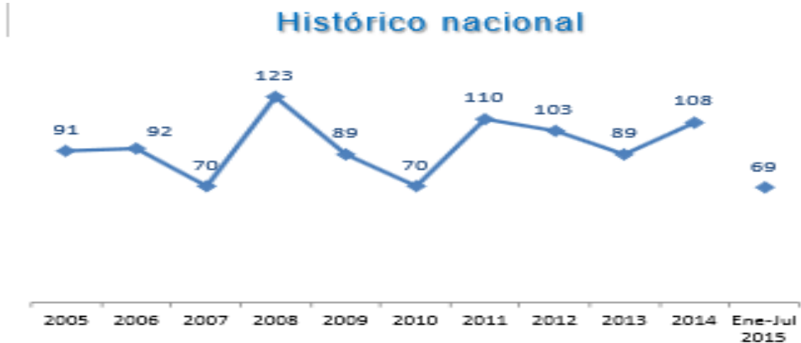
Gráfico N° 6.

HURTO A ENTIDADES FINANCIERAS 2005 – 2015.