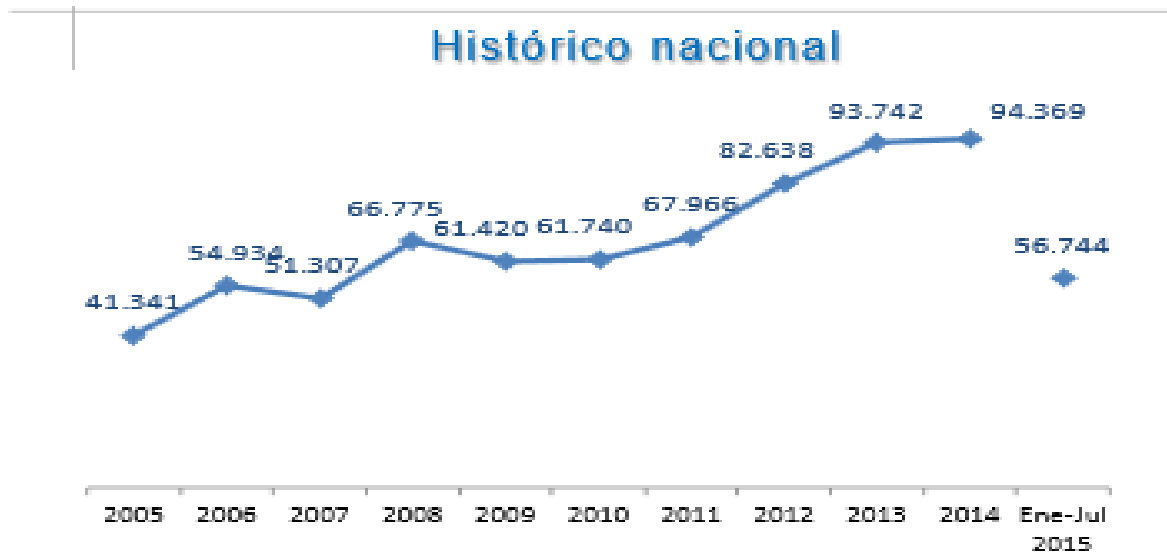
Gráfico N° 1. Fuente: Ministerio de Defensa Nacional. Logros de la Política Integral de Seguridad y Defensa para la Prosperidad – PISDP.