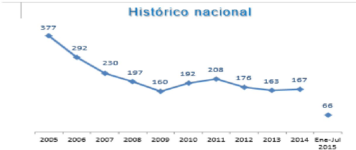
Gráfico N° 10. Fuente: Ministerio de Defensa Nacional. Logros de la Política Integral de Seguridad y Defensa para la Prosperidad – PISDP.