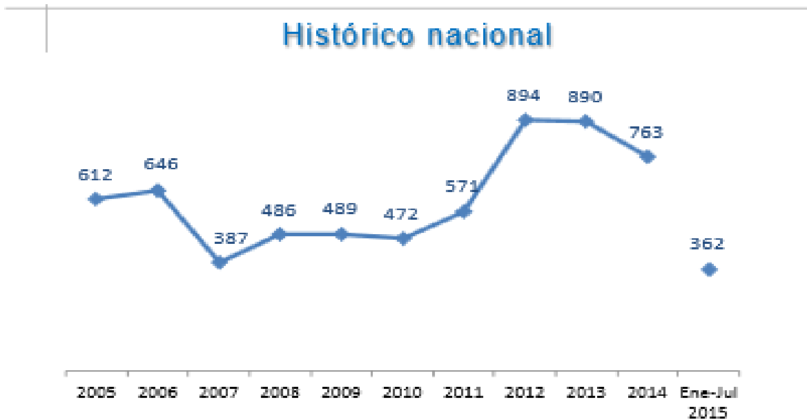
Gráfico N° 3. Fuente: Ministerio de Defensa Nacional. Logros de la Política Integral de Seguridad y Defensa para la Prosperidad – PISDP.

El Ministerio de defensa Nacional destaca la reducción de actos de terrorismo en los últimos años: