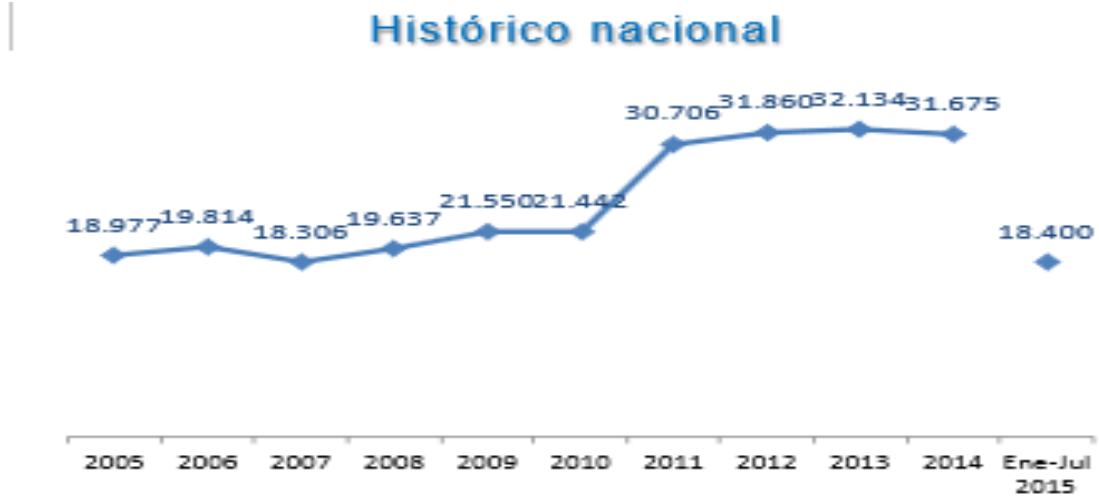
Gráfico N° 8. Fuente: Ministerio de Defensa Nacional. Logros de la Política Integral de Seguridad y Defensa para la Prosperidad – PISDP.