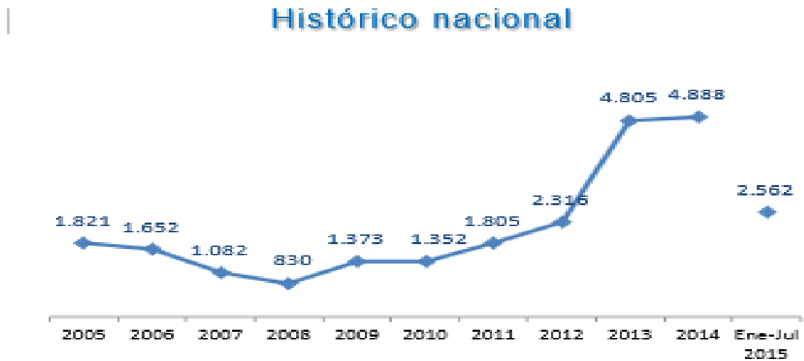
Gráfico N° 11. Fuente: Ministerio de Defensa Nacional. Logros de la Política Integral de Seguridad y Defensa para la Prosperidad – PISDP.