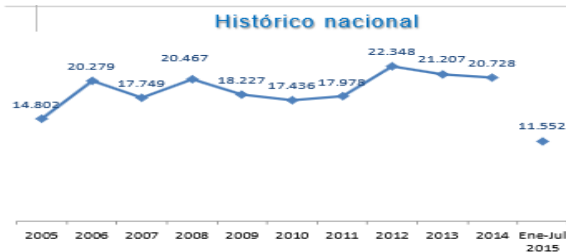
Gráfico N° 7. Fuente: Ministerio de Defensa Nacional. Logros de la Política Integral de Seguridad y Defensa para la Prosperidad – PISDP.