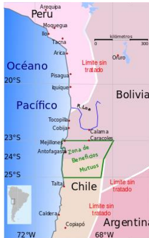
Zona de beneficios mutuos y puertos bolivianos arrendados a Chile 1866

instancia encontramos que los productos provenientes de la explotación en el sector de Mejillones, rico en guano, se repartirían por mitades. Para ello, Bolivia habilitaría la bahía y puerto de Mejillones estableciendo un punto de aduana para el desarrollo de industria y comercio de la zona. Siendo estos productos libres de todo derecho de exportación extraídos por los diferentes puertos se pondrían a disposición de los Estados en cuestión para sus fines individuales.