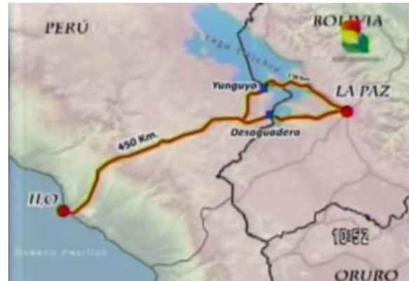
Territorio acordado por Perú y Bolivia

negando definitivamente las posibilidades futuras de Bolivia a tener una salida al mar. (p.21).