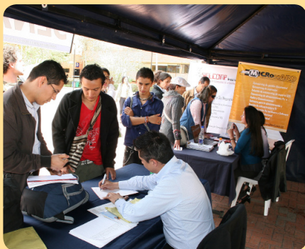
Jomada de Oportunidades Laborales - JOL

Octubre terminó, como es habitual en esta época del año, con muchos eventos académicos, culturales y deportivos que representan la actividad constante del mundo universitario de nuestra comunidad. Llega noviembre con una alta dosis de tensión para docentes y estudiantes que entran en la etapa de cierre y ajuste de notas, mientras el personal administrativo prepara el cierre de actividades del año de los 30 años.