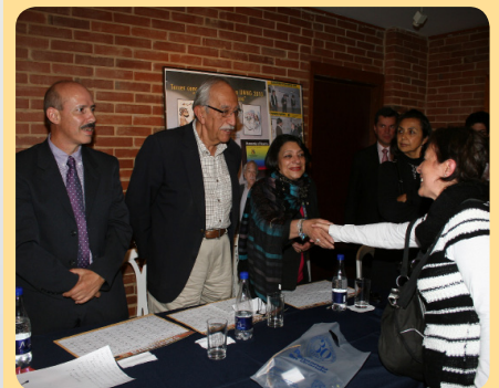
V Concurso de Caricatura