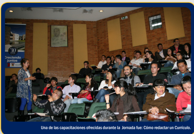
Una de las capacitaciones ofrecidas durante la Jornada fue: Cómo redactar un Currículo.

La asistencia estudiantil ascendió a más de 2000 personas interesadas, quienes registraron su hoja de vida, en siquiera una empresa ó temporal. La actividad culminó en completo orden y se perfiló como una de las actividades con mayor apoyo y aceptación de toda la Comunidad Neograndina.