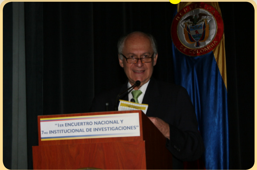
Encuentro de Investigaciones UMNG

Octubre terminó, como es habitual en esta época del año, con muchos eventos académicos, culturales y deportivos que representan la actividad constante del mundo universitario de nuestra comunidad. Llega noviembre con una alta dosis de tensión para docentes y estudiantes que entran en la etapa de cierre y ajuste de notas, mientras el personal administrativo prepara el cierre de actividades del año de los 30 años.