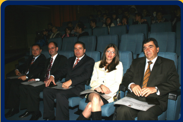
Cinco de los creadores de las patentes registradas por la Universidad fueron condecorados de manos del Rector con la Moneda Institucional.

En el encuentro se condecoró con la Medalla Institucional a los docentes neogranadinos cuyos inventos han llevado a la Universidad Militar Nueva Granada a encabezar los listados de Instituciones Educativas con más patentes registradas en el País.