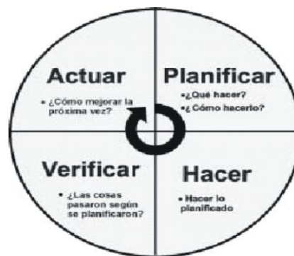
Ciclo P – H – V – A

El proceso de planeación de objetivos se dará de manera práctica y con sentido, siendo lo más claro posible, sin permitir que surjan mayores dudas acerca de lo que se quiere lograr. Para tal fin todo buen líder debe hacer uso del proceso de mejora continua, enmarcado en el ciclo P – H – V – A planteado por William Edwards Deming a partir del año 1950 y desarrollado por Walter Shewhart (citado por Correa, 2011, 26 de enero) el cual dio origen al concepto.