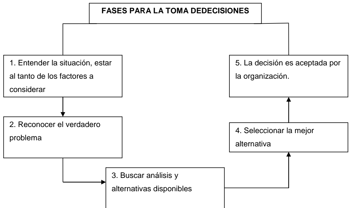
Figura 2. Fases para la toma de decisiones

Se puede decir entonces que la toma de decisiones es un proceso que se torna algo complejo y por tanto W.H Weiss sugiere que se debe seguir un orden específico para llevarlo a cabo.