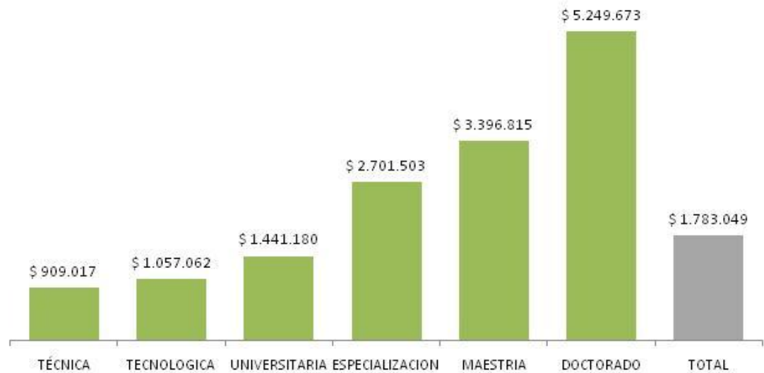
Gráfica 2. Ingresos de Recién Egresados

En cuanto a la propuesta de Competitividad, el Gobierno se comprometió a implementar una serie de acciones de corto, mediano y largo plazo que apuntan a mejorar la situación de la educación en el país. Incluye acciones que están previstas a ser finalizadas a más tardar en 2016.